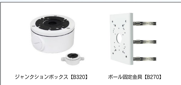
ジャンクションボックス【B320】